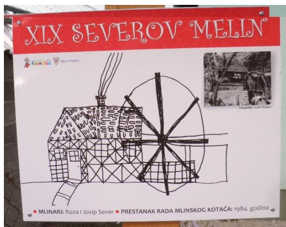
Slika 3. Interpretacijska ploča uz „Severov melin“ iz projekta Dječjeg vrtića „Ivančice“ iz Ivanca, MLINOVI NA POTOKU BISTRICA

Projekt je „potpuno svoj u odnosu na rutinske stavove turističkih stručnjaka i stavova većine odraslih turista, ali i đaka osnovnih i srednjih škola. S jedne strane, djeca mlinove doživljavaju segmentirano, kao vodu, kao hranu, kao kamenje, ribice i rakove te posebne biljčice, kao stare građevine i čudne uređaje, a s druge strane, potpuno uopćeno, uklopljene u potok Bisticu, u krajolik. Konačni rezultati su čudesni“ (prospekt). Postaje uz lokacije mlinova su opremljene su reprodukcijama dječih crteža predškolske dobi (slika 3.).