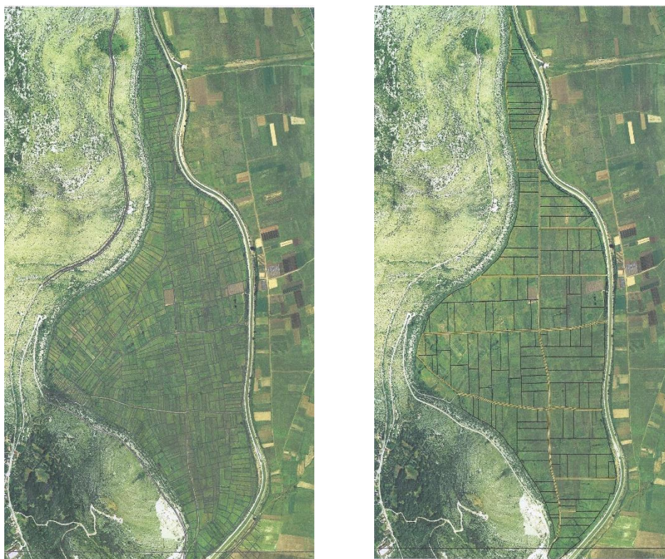
Slika 2. Stanje prije i poslije komasacije

Komasacija zemljišta na lokalitetu „Donja Luka“ je najznačajniji korak prema održivom ruralnom razvoju općine Ravno. Ova komasacija provedena je na manjoj površini poljoprivrednog zemljišta u Popovu polju, ali je zbog njezinih izuzetnih rezultata izazvala veliku zainteresiranost i spremnost ostalih poljoprivrednih proizvođača po različitim K.O. za pokretanje novih projekata komasacije. Ova uspješno završena agrarna mjera doprinijela je da mnogobrojni posjednici koji su odavno napustili općinu Ravno ponovno započinju aktivno bavljenje poljoprivrednom proizvodnjom. Jedan dio posjednika je iskazao spremnost za ustupanjem svog zemljišta državi ili drugim osobama koji su zainteresirani za bavljenje poljoprivrednom proizvodnjom.