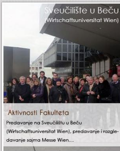
Sveučilište u Beču (Wirtschaftsuniversität Wien)