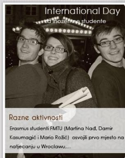
International Day za inozemne studente